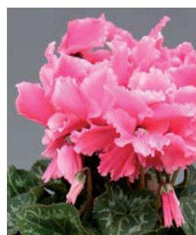
Salmon Light Edge