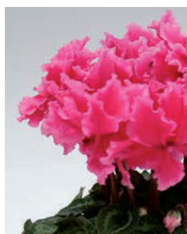
Pink Light Edge